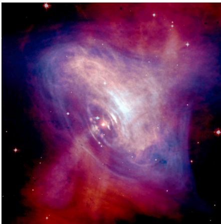
図 1: X 線と可視光線領域で見える「かに星雲」(Crab Nebula)。写真の中央がかに星雲。

LIGO-Virgo-KAGRA コラボレーション（以下、LVK 共同研究チーム）は、中性子星からの極めて微弱な連続重力波 (continuous gravitational waves) の新たな探索結果を発表しました。2023 年 5 月から行われている第 4 期観測の初期 (2024 年 1 月まで) の期間 (O4a) のデータに対するこの探索は、ブラックホールの合体などの劇的なイベントではなく、安定し、孤立した物体から放出される重力波を捉えるという研究に、新たな一歩を踏み出したこととなります。連続重力波は微弱で安定したほぼ周期的な信号であり、ブラックホールを除けば宇宙で最も密度の高い物体である中性子星の内部について教えてくれるかもしれません。