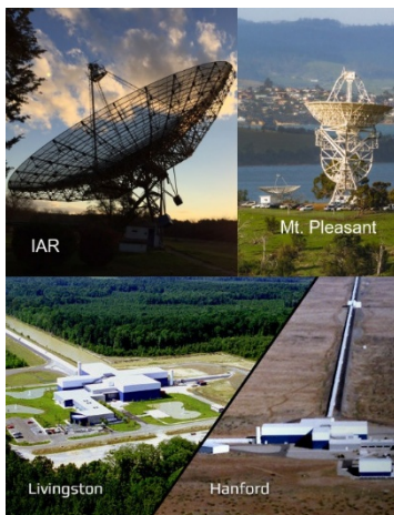
Figura 2: Os quatro observatórios que participaram neste trabalho: dois radiotelescópios na Argentina e na Tasmânia, e os dois detetores de ondas gravitacionais LIGO nos EUA.